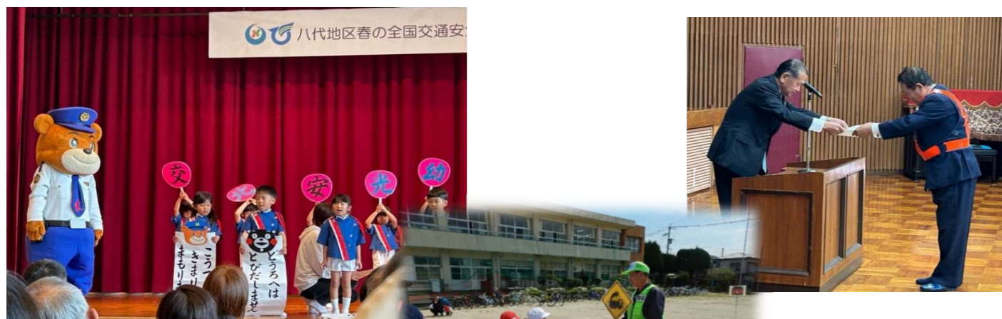
↑交通安全宣言の様子