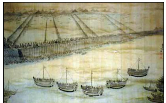
七百町干拓潮止め風景