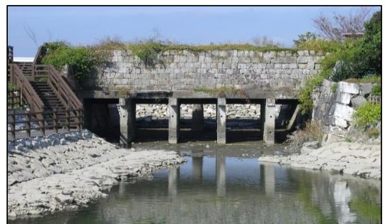
大鞘樋門(県指定史跡)