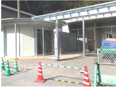
トイレ・ベビーコーナー・情報提供施設 身障者・妊婦用優先駐車場新設！！

発行：八代市東陽支所 編集：東陽支所地域振興課 (Tel.65-2111) 発行日：令和3年3月1日