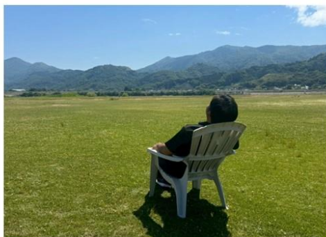
プレミアムSA席 (料金/1人 15,000円)