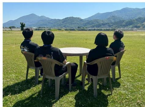
DXテーブル席 (料金/4人 35,000円)