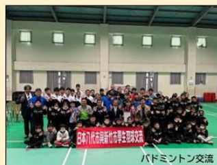
バドミントン交流