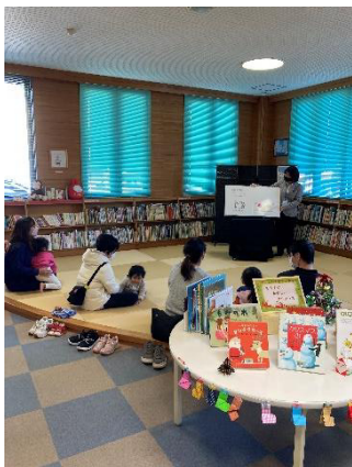
図書館(せんちょう分館) でのお話会