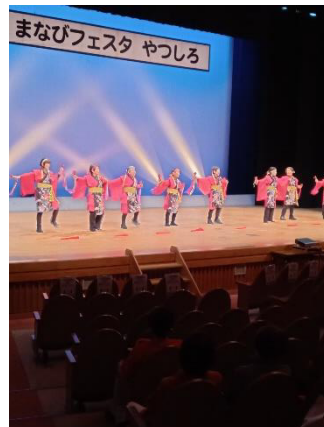
自主講座クラブによるステ ージ発表