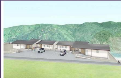
坂本町災害公営住宅(合志野地区)イメージ図