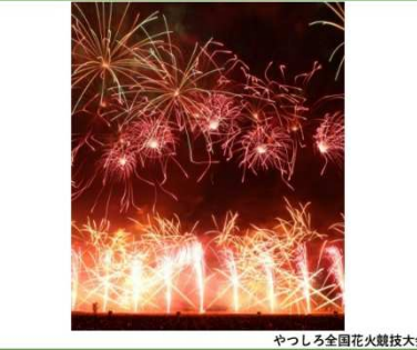
やつしろ全国花火競技大会