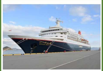
くまモンポート八代にっぽん丸が初寄港