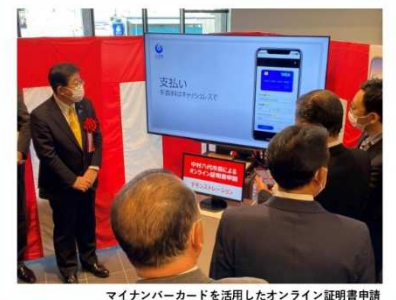
マイナンバーカードを活用したオンライン証明書申請