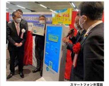
スマートフォン充電器