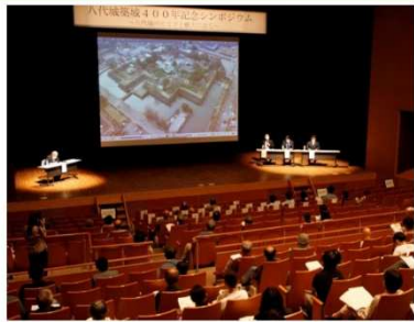
八代城築城400年記念シンポジウム