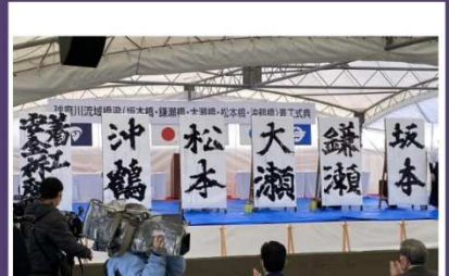
球磨川流域橋梁着工式