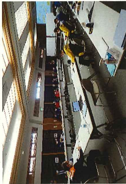
＜令和2年度訓練の様相＞