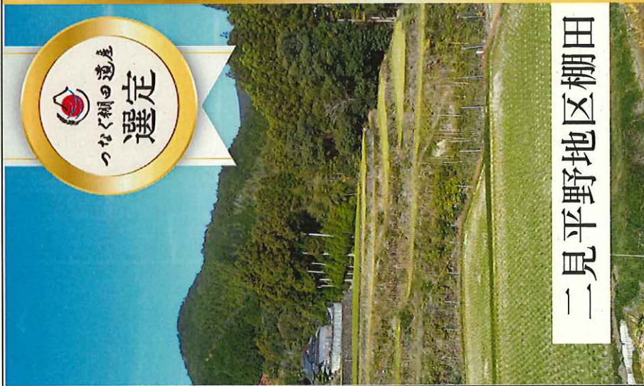
二見平野地区棚田