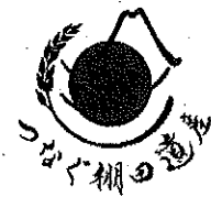
【つなぐ棚田遺産ロゴマーク】