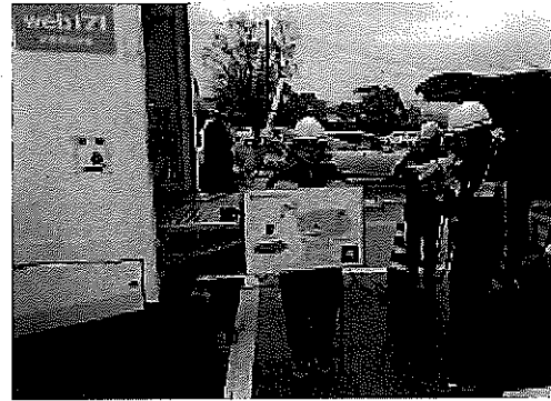
通信事業者によるデモンストレーション (令和元年11月22日 宇城市)