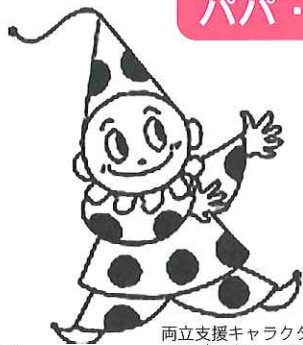
両立支援キャラクター 両立するべえ