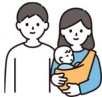
育児は女性の役割？

まずは、自分自身が「思い込み」に気づくこと、そして周りの人の「思い込み」や「決めつけ」に気づいたら声をかけあうことも大切です。