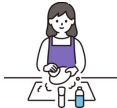
家事は女性の役割？