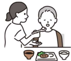
介護は女性の役割？