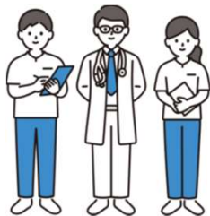
医師は男性が多い？