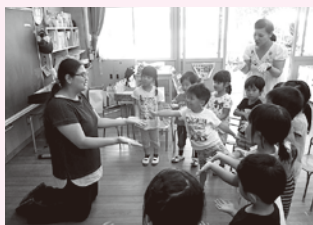
ALTと英語であいさつ

社会のグローバル化により英語教育に関心が高まっています。本市では市立の6つの幼稚園にALT(外国語指導助手)が訪問し、子どもたちはALTとのふれあいを楽しんでいます。