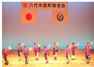
アトラクション 鏡町民生・児童委員協議会 (左) コールせせらぎ (右)