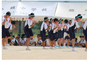
伝統の大鞘名所の演舞

競技中の天候の崩 れもなく、プログラ ムも予定通り行わ れ、全校生徒336 人が赤団・青団・黄団に分かれ競 いました。