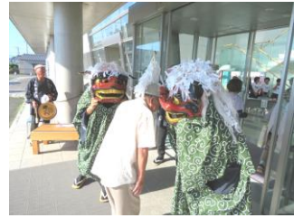
獅子舞によるお出迎え

式典閉会の後、アトラクションとして日舞、ダンス、合唱など披露され盛会のうちに終了しました。