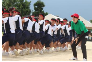
綱引き：先生の応援も力が入ります