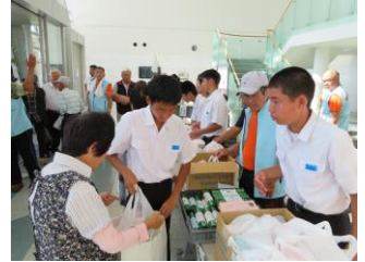
鏡中の生徒も記念品配布のお手伝い