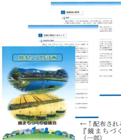
←配布される『鏡まちづくり計画』(一部)