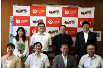
市長と条例検討委員(鏡まちづくり徳田事務局長(右下)も検討委員として参加)