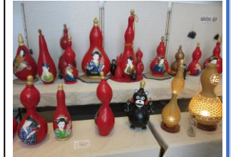
昨年度展示の部の作品 (ひょうたん)