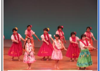
昨年度舞台の部の様子 (フラダンス)