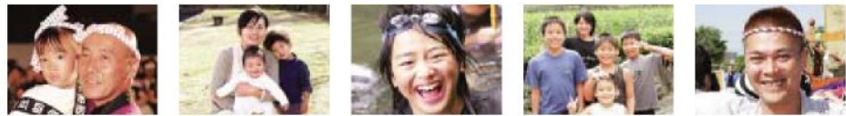
Yatsushiro - a cheerful town 朝日登勢前八代 야츠시로의 집