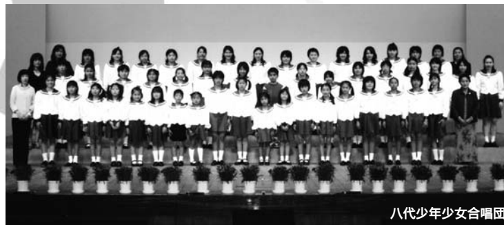
八代少年少女合唱団