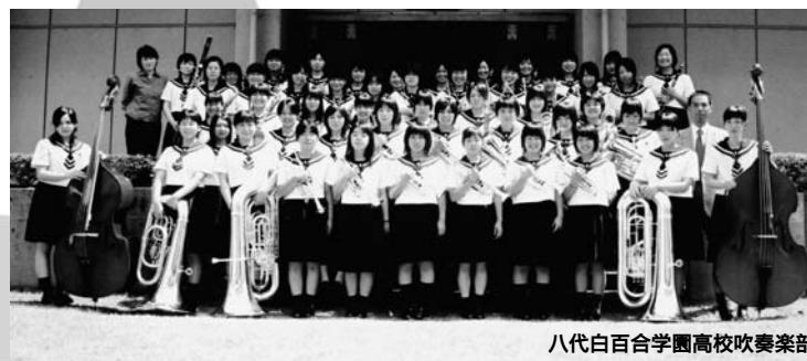
八代白百合学園高校吹奏楽部