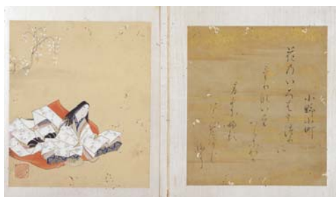
ひゃくにんいっしゅう 百人一首画帖より 第九首 小野小町 折本装・寛文10年(1670) 江戸時代前期 作者 狩野安信・時信・益信・常信 松井文庫所蔵

百人一首といえは、上の句を聞いて、下の句が書かれた札を取るカルタ遊びが盛んですが、和歌や書道のお手本としても親しまれてきました。