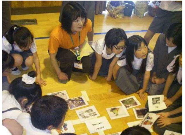
まちづくり出前講座の様子