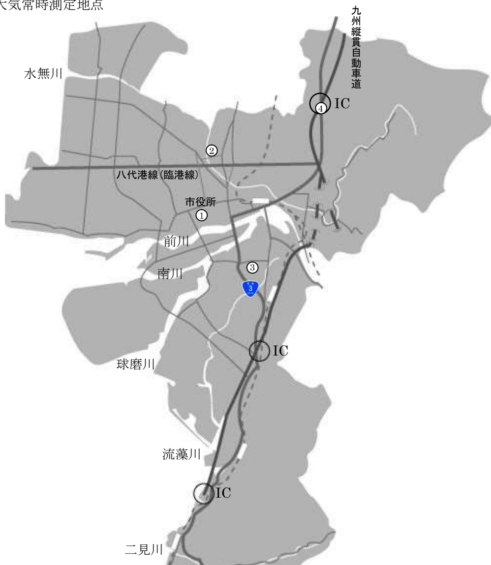
図一1 大気常時測定地点

平成 27 年度は県内 36 局(一般環境測定局 33 局、沿道の自動車排ガス測定局(以下、「自排局」) 3 局)で大気汚染の常時監視を実施した。