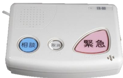
(本体装置＋ペンダント型)