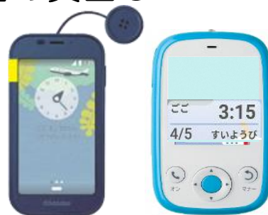
(携帯型は市が決めた要件を満たす場合のみ)