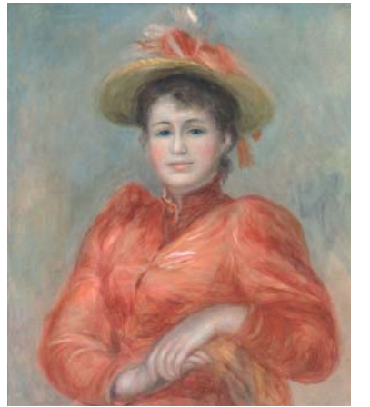
赤い服の女 ルノワール 1892年ごろ

現在博物館では、東京富士美術館所蔵のコレクションの中から、印象派を中心とする西洋絵画の名品52点を展示しています。