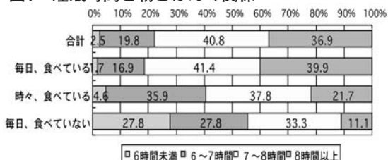
図1 睡眠時間と朝ごはんの関係

9月15日号「広報やつしろ」P2図1のグラフに間違いがありました。正しくは下記のグラフになります。ここにお詫びし訂正いたします。