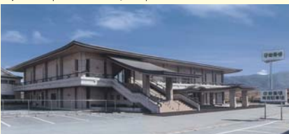
八代市麦島東町 TEL 33-3161