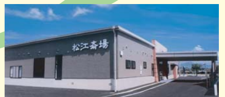
八代市松江町 TEL 30-7555