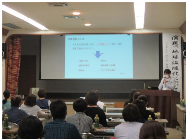
まちづくり出前講座の様子