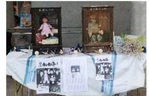
※昨年の愛鏡祭の様子