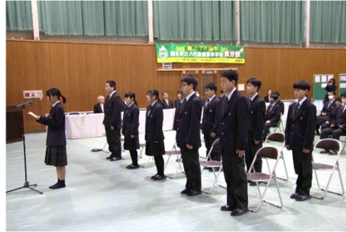
▲ 八代農業高校泉分校入学式