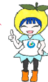
呉 健 診 ぼ ん べ い じ