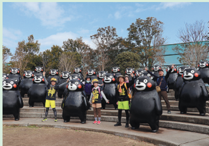
くまモンポート八代