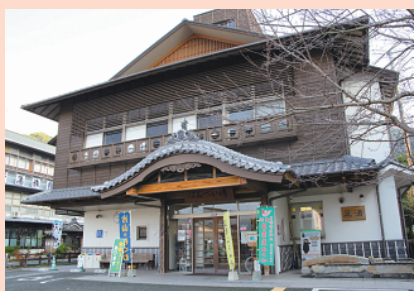
日奈久温泉ばんべい湯