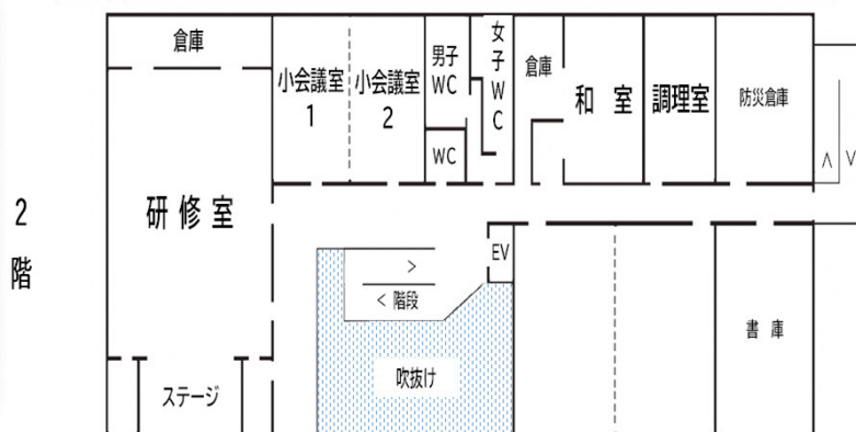
八代市坂本支所・坂本コミュニティセンター・坂本診療所 フloor案内図