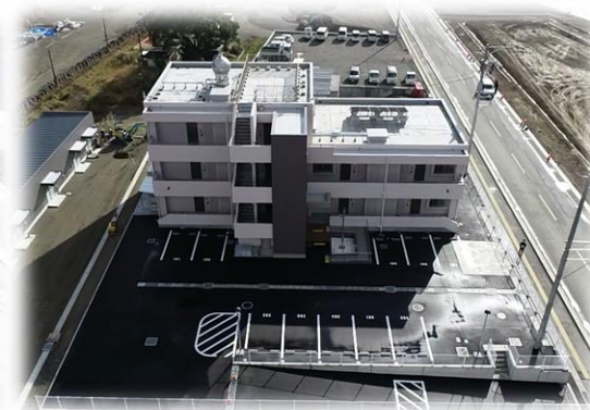
災害公営住宅坂本団地