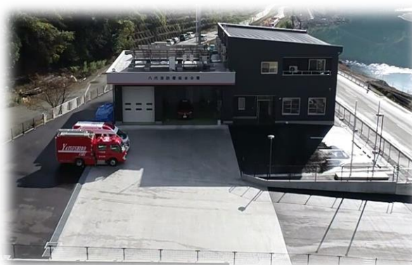
八代消防署坂本分署