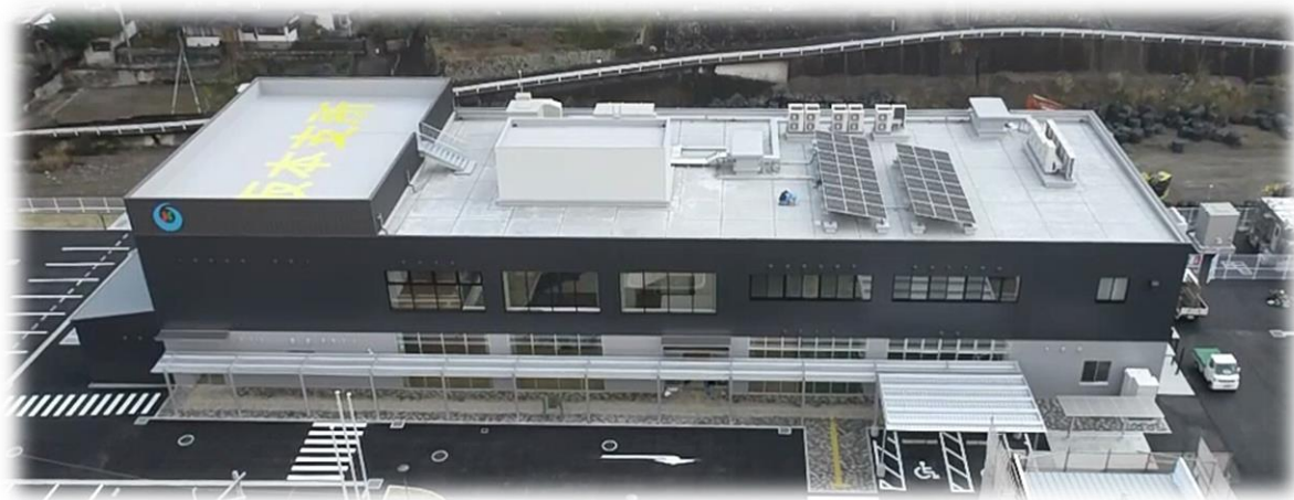
坂本支所・坂本コミュニティセンター