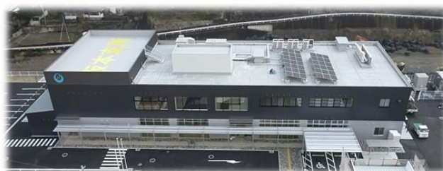
坂本支所・坂本コミュニティセンター