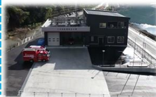
八代消防署坂本分署