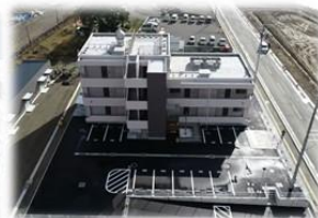
災害公営住宅坂本団地