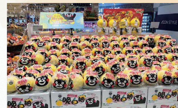
香港での晩白柚フェア