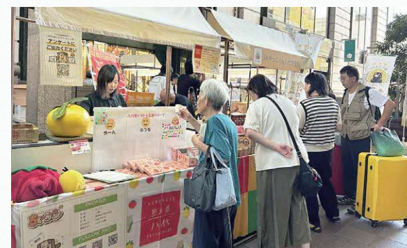
博多でのイベント

国外では、香港や台湾においてテストマーケティングや商談会などに取り組んでいます。近年はさらにシンガポールを新たなターゲット国に設定し、販路開拓にチャレンジしています。