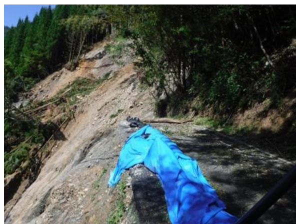
令和4年台風14号の被害状況 (八代市泉町八八重～四方田線：被災箇所①)