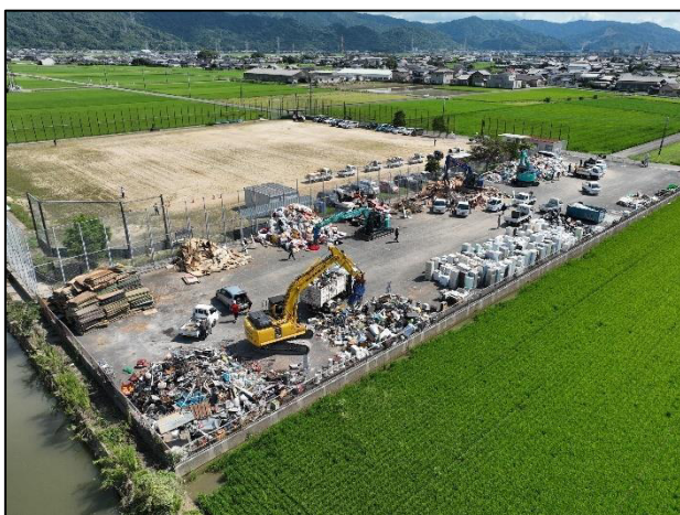
③ 千丁東グラウンド 集積状況