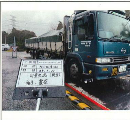
②計量(総重): 九州北清俣