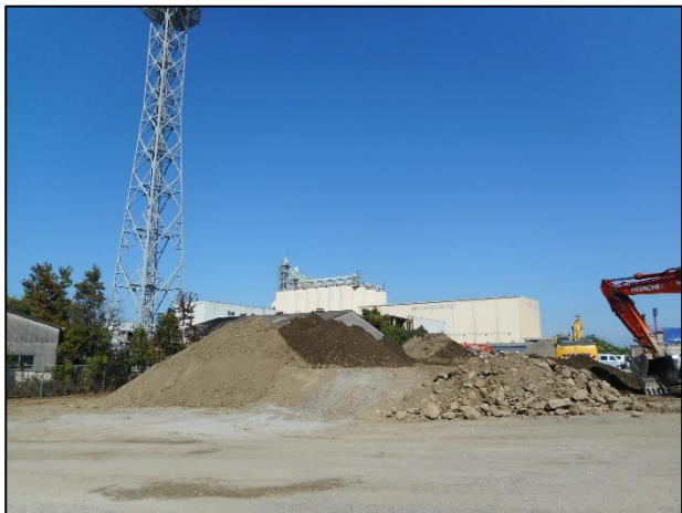
① 水処理センター 土砂混じりがれき