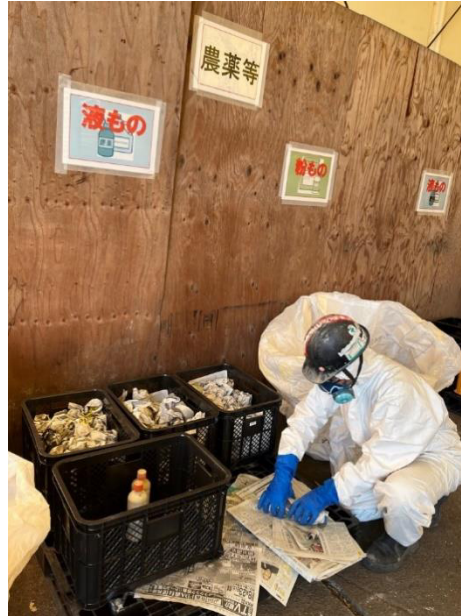
農薬（液体）の梱包作業