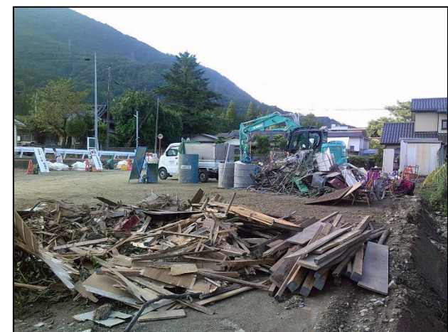
④ 旧龍峯幼稚園跡地 集積状況