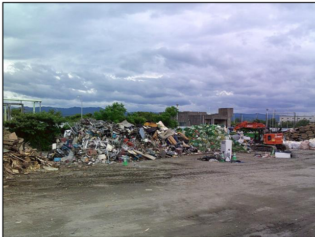
① 水処理センター 集積状況