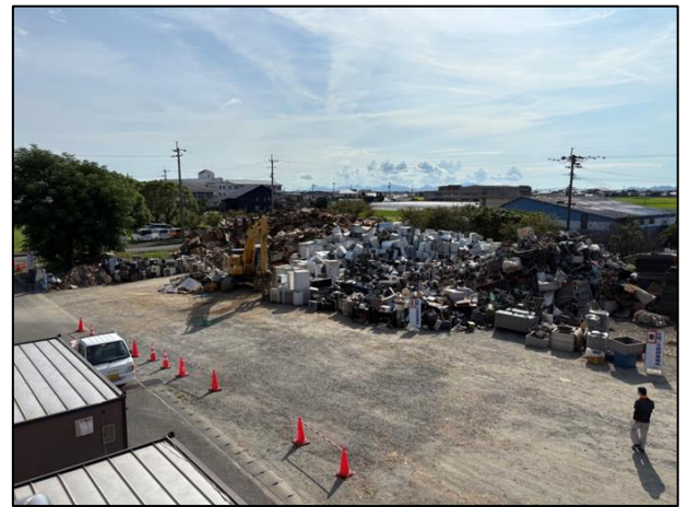
② 鏡支所西側 P 集積状況