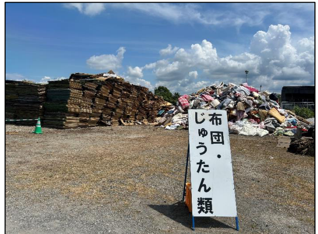
① 水処理センター 畳及び布団類