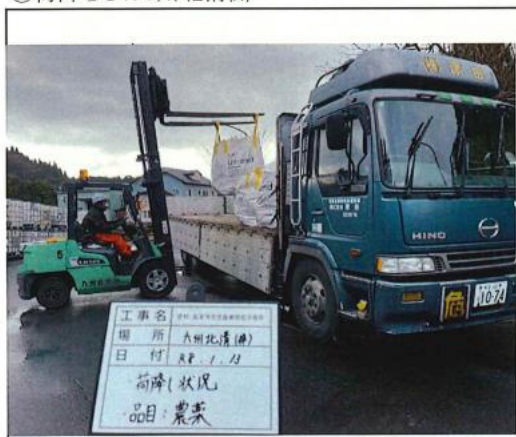
③荷降ろし: 九州北清俣