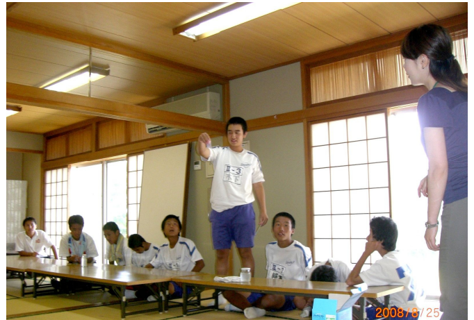
まちづくり出前講座の様子