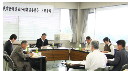
▲ 11月開催の外部評価委員会の様子

市で「内部評価」（事業を担当する部署で評価）した事務事業の「妥当性・有効性・効率性」の評価内容について、外部評価委員が第三者の視点で検証し意見を述べる手法です。