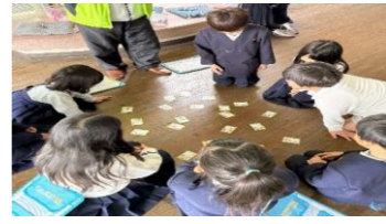
高田小学校昔遊び