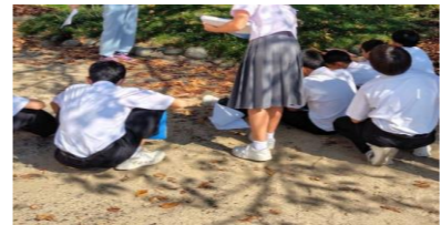
第五中学校フィールドワーク

八代市立の全ての小・中・特別支援学校では「地域学校協働活動」を実施しています。この活動は、地域の皆さんの知識や経験を生かし、地域と学校が手を取り合って学びの場を作りだし、子どもたちの成長を支える取り組みです。活動内容は、学校行事の補助、授業への参加、皆さんの特技や経験を活かした学習の提供など様々です。令和7年10月～令和8年1月までの活動のご紹介をします。地域の皆様、ご協力をいただきありがとうございました。