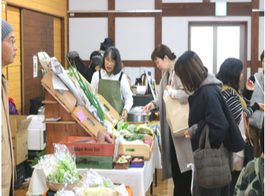
無農薬野菜を買い求める来場者

4回目の開催となった「日奈久小祭り」この「こえ」が、2月7日(土)にゆめ倉庫で開催されました。会場の日奈久ゆめ倉庫には、北は荒尾、和木、南は水俣、津奈木から多くの商品が並びました。今回は4店舗増えて18店舗に増え、無農薬栽培の野菜やコーヒー、お茶などの販売に「インスタを見て来ました」と県内各地より多くの親子連れが来場していました。