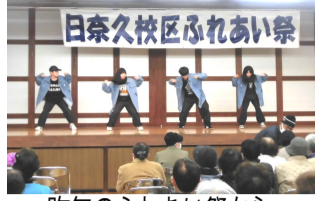
昨年のふれあい祭から