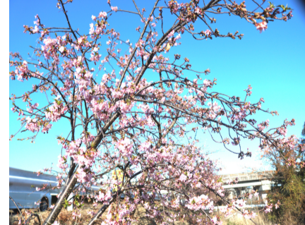
新開堤防の河津桜が開花 2月18日撮影