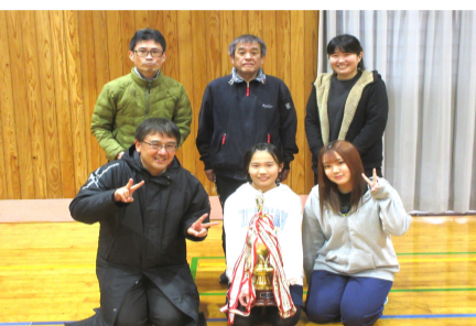
優勝した塩南チーム

がりました。栄えある優勝の栄冠を手にしたのは、塩南町チームでした。おめでとうございます。2月の開催は初めてでしたが、熱中症の心配もなく午後1時半から5時位までのスケジュールもタイムリーでした。2位は、山下町、3位は、東町中町中西町合同、以下は、竹之内町、新田町、塩北町新開町、大坪町の順でした。皆さんお疲れ様でした。