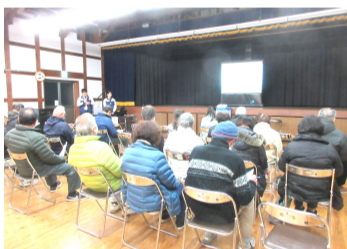
講義に聴き入る参加者

・第31回九州国際スリーデーマーチ3日目の3月8日(日)に日奈久温泉コース(30km)が計画されています。婦人会の皆さんがゆめ倉庫において、ちぎり天などでおもてなしをします。ちくワンも一緒に参加者の皆さんを応援します。地域の皆さんも笑顔と挨拶で迎えたいと思います。