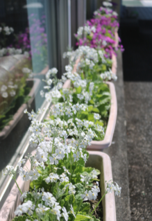
日奈久出張所の桜草