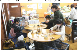
木を使って工作する子

会場には、木や皮を使った製作ブラスがあったり、ステージでは読み聞かせが行われたりと子供たちも楽し