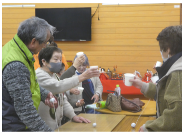
紙コップけん玉で盛り上がる参加者

紙コップで作ったけん玉で団体戦で興奮し、底に1から14が書いて裏返しに置いてある紙コップを順番に取り個人戦では、応援の声で盛り上がりました。 3、情報交換 7町内の活動状況報告と男性の参加を増やすには声かけをこまめに行うと結論づけました。 今回の研修会は全員参加で楽しく講習できました。これを機にいきいきサロン開設が増えることを期待しました。