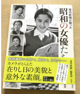
写真集「昭和の女優たち」

本は「昭和の女優たち」。昭和時代の映画を飾った高年齢者にはおなじみの懐かしい女優の写真集で、最近出版されたものです。日奈久コミュニティセンター事務室にありますので、ぜひご覧ください。