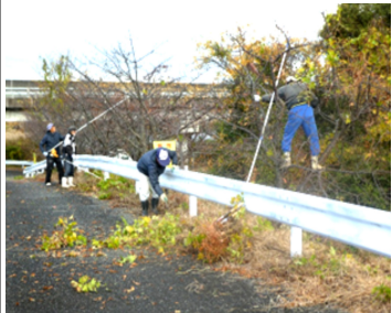
手際よく作業する参加者