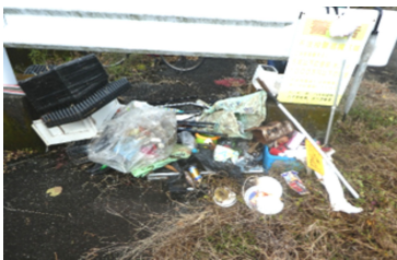
残念ながら後を絶たない不法投棄 絶対にやめてほしいものです