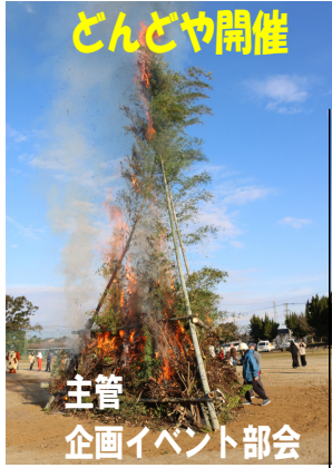
主 管 企画イベント部会

その間、八代市消防団長を12年、熊本県消防協会会長を5年（役員では16年）務めました。「災害時には待機して消防団幹部と対策を練ったり、市長からの要請があれば対応したりしました。団長として県全体が良い方向に進むように努力してきました」と話されました。「令和7年3月31日に退団し、ようやく気持ちのゆとりができました。今後は、必要とあれば、日奈久のために努力したい」と力強く語られました。