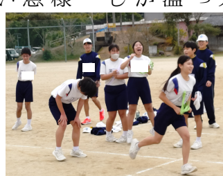
寒い中調査をする参加者の皆さん

この日は夕方から急に寒くなっただけもあり、行き交う人や買い物に来る人も少なく、自転車の利用者は2カ所所20人。そのうちヘルメットをかぶっている人は1