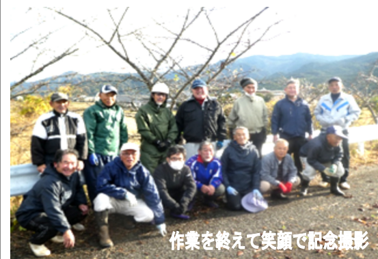
作業を終えて笑顔で記念撮影

11月28日（金）11月とは思えないほど暑い中、日奈久小・中学校のクリーン作戦が行われました。