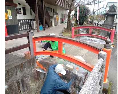
きれいに塗装する参加者

温泉センター「ばんべい湯」の北側、石橋の欄干がきれいに塗装されました。塗料等の材料を準備して、作業は有志3人で実施されました。