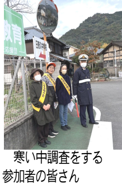
寒い中調査をする参加者の皆さん

◆期日 12月30日（火）から1月3日（土）まで ◆場所 日奈久温泉神社イベント広場