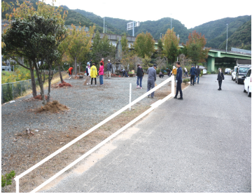
四角い枠をめどに作製します

12月6日（土）アグリ日奈久隣の作業所において竹灯籠が作製されました。 有志が集まり、年末年始の温泉神社イベント広場で開催される竹灯りと2月末から3月初めに行われる雛祭りをより華やかにし