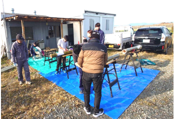
八代高専の生徒5人も加わり製作

住民自治会が、熊本県木材協会連合会の補助金を受けて、1月中に津森小学校遭難の碑の横に塀を作ります。2月にはお披露目を兼ねた餅投げも計画しています。