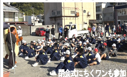
開会式にちくワンも参加

達が生んでる町をきれいにしたい一人が心がけ、一つもゴミがない町にしたいものです。