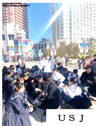
U S J