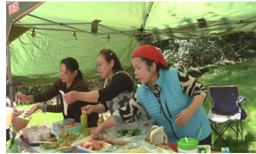
▲参加者へのおもてなしの様子