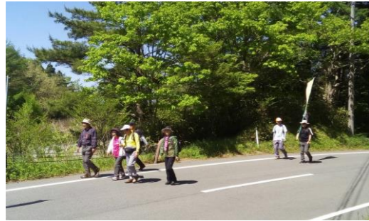
▲ウォーキングを楽しむ参加者

泉町においては、11日(金)に、二本杉峠展望所からせんだん轟までの10キロを歩く、「秘境五家荘コース」が行われました。当日は、汗ばむくらいの陽気のなか、14人の参加者は、和気あいあいとした雰囲気、五家荘の大自然の中のウォーキングを楽しみました。給水所では、地元の方からのご好意と婦人会のボランティアのご協力により、キュウリやとうもろこし、桃のコンポートなどが提供され、参加者の皆さんからは笑みがこぼれていました。ゴールのせんだん轟では、数日前の雨により、水量が増した大迫力の滝を見ることができました。完歩後は、煮しめやヤマメの甘露煮などの山の幸に舌鼓を打ち、新緑の五家荘を満喫されました。