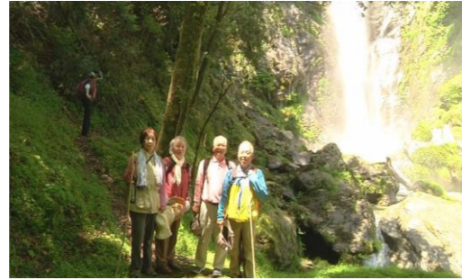
▲ゴール間近のせんだん轟にて