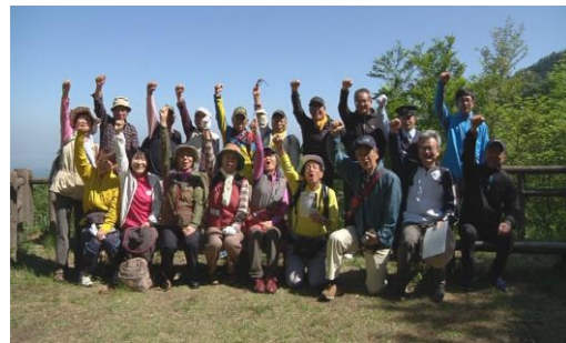
▲参加者のみなさん