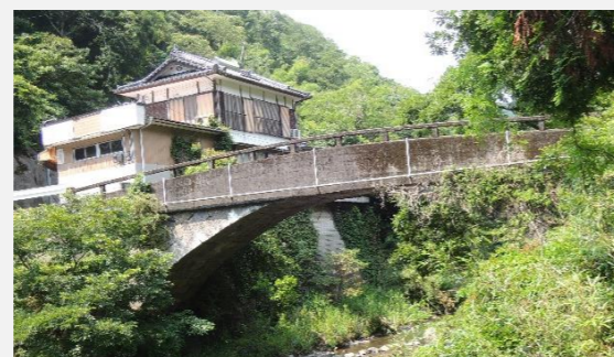
氷川下流側から撮影

【沢無田橋】橋長20.4m、橋幅3.5m、径間18.3m、明治10年架設。下岳神社下の氷川本流に架かる。市道沢無田線の現役橋梁で、国道443号と沢無田地区を結ぶ。泉町では2番目に長い石橋で、橋名板を見ると昭和34年11月20日の記載があり、当時コンクリートで橋梁上部、高欄部等を補強したことが窺える。橋梁下部には、緩やかなアーチを描く当初の石組を見ることができる。（参考文献：上塚尚孝著「熊本の目鑑橋345」熊本日日新聞社刊）