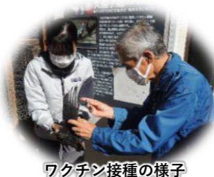
ワクチン接種の様子