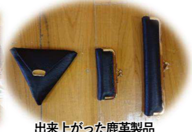
出来上がった鹿革製品