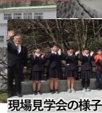
現場見学会の様子