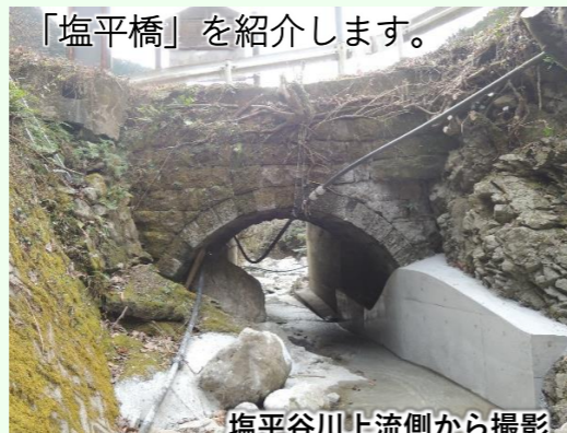
塩平谷川上流側から撮影

【塩平橋】橋長5.5m、橋幅3.9m、径間3.6m、大正初期頃の架設。国道443号を氷川沿いに進み泉町に入る目印になるのが森林組合の案内看板と氷川に架かる県道本屋敷橋。そのすぐ手前で国道が氷川に注ぐ小さな谷川を跨いでいるのが「塩平橋」。そこに石橋があるとは思ってもよらないが、近づいて見てみると、国道を新「塩平橋」と一体となって陰で支える縁の下の力持ちの姿がそこにある。(参考文献:上塚尚孝著「熊本の目鑑橋345」熊本日日新聞社刊、「泉村誌」)