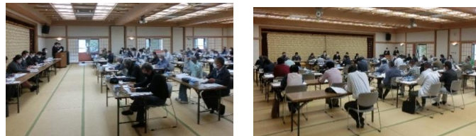
4月14日(木) 泉校区市政協力員会総会の様子