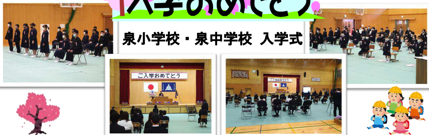
泉小中学校 入学式