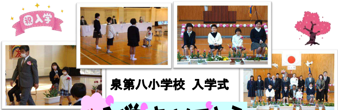
泉第八小学校 入学式

泉小中学校(4月11日)と泉第八小学校(4月8日)にて、保護者や先生・関係者に見守られながら、令和4年度入学式が行われました。今年度も参列に関して限定的となりましたが、泉小中学校では小学生4名・中学生7名、泉第八小学校では1名の児童・生徒が入学式に臨みました。新しい環境で不安や緊張がある反面、それぞれの夢と希望を抱きながらの学校生活をスタートしました。