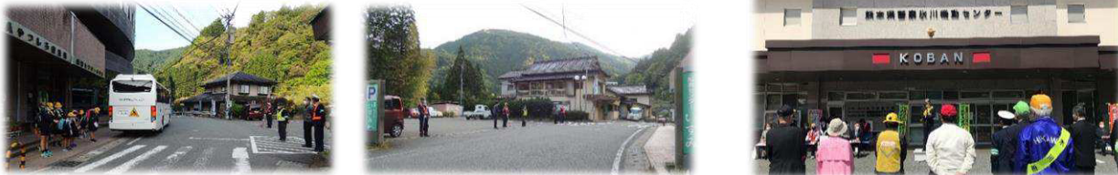
振興センターいすみ前での街頭指導

4月4日(月)～15日(金)で「春の全国交通安全運動」が実施され、期間中、泉町の各所で交通指導員の皆さんによる街頭指導が行われました。振興センターいすみの前では、スクールバスで登校した泉小中学校の児童・生徒の皆さんと挨拶を交わされていました。