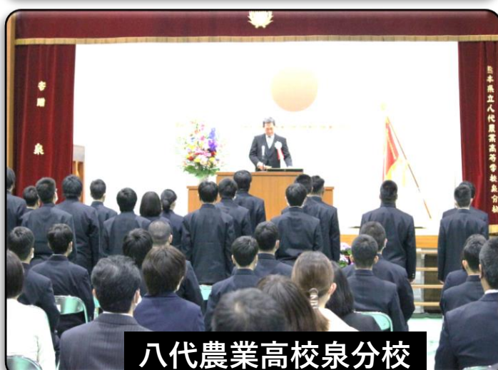
八代農業高校泉分校