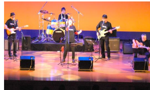
演奏するメンバー (鏡文化センター)

泉町在住者らで構成する音楽バンドのDS♥IOCが音楽祭の一日目のトリを務めました。