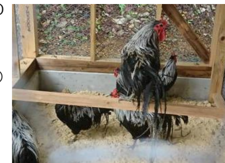
▲新しい鶏舎で過ごす久連子鶏

なお、今後は、災害や天敵などから久連子鶏を守るため、久連子地区外の五家荘地域の方にも飼育にご協力いただく予定です。