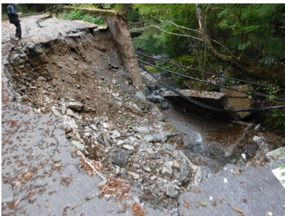
令和4年台風14号の被害状況 (八代市泉町五家荘～椎葉線：被災箇所④)