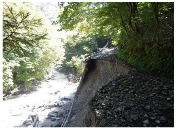
令和4年台風14号の被害状況 (八代市泉町五家荘～椎葉線：被災箇所③)