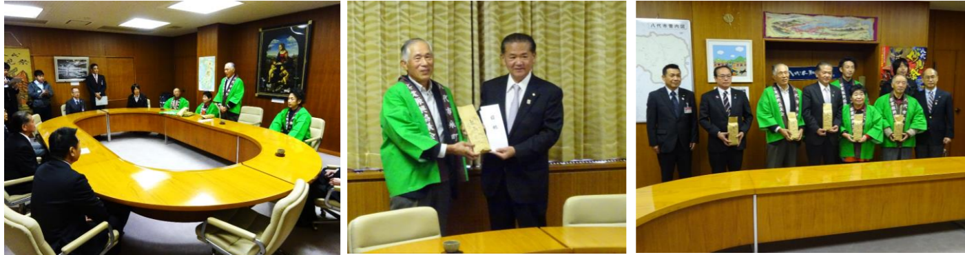
▲うがい用お茶の贈呈式の様子

これはインフルエンザ感染予防対策や虫歯予防に、お茶に含まれるカテキンやフッ素などの成分が有効と言われており、市内の幼稚園、小・中学校の園児・児童・生徒の『うがい用のお茶』として、泉町茶業振興協議会の皆様が贈呈されたものです。今年で8回目となります。