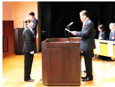
▲委嘱状交付式の様子