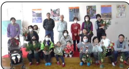
参加者と指導者の皆さん

12月10日、東陽定住センターで泉町観光ガイド・インストラクター協会主催の「親子で作ろう！クリスマスリース&ミニ門松作り体験」が行われ、親子連れなど8組20人が参加しました。この日は、同会員5人の指導のもと地元で採取されたツタや竹などを材料にクリスマスリースとミニ門松作りが行われました。参加者からは、「クリスマスリースに加えて門松も作れて、教えてくださる方もとても優しく、本当に大満足でした」との声が聞かれました。