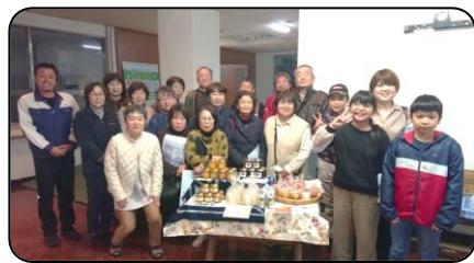
視察団とゆずの香の皆さん