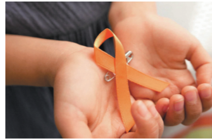
オレンジリボンには子ども虐待を防止するというメッセージが込められています。